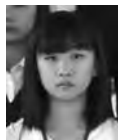
「広島視察研修に参加して」