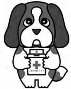
▲日赤北海道支部 マスコットキャラクター アンリー