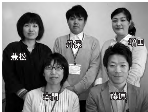
《地域包括支援センター職員》 私たちが訪問させていただきます

・センター職員には守秘義務が課せられており、訪問で知りえた情報は決して他にもれることはありません。ご本人に同意なく、その情報を使用することはありません。