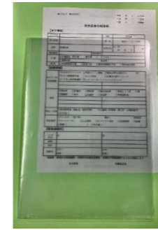
救急医療情報用紙と クリアファイル