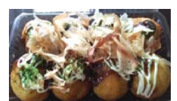
たこやき (8個) ¥350