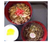
豚生姜丼ミニそばセット ¥600