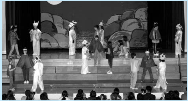
18日 南京っ子学芸会