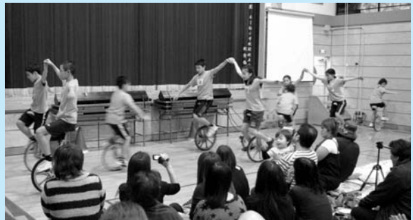
23日 第40回勤労感謝祭